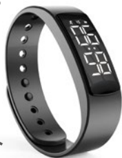
歩数ブレスレット

歩数計は、運動量を可視化することができ日々のウォーキングや運動のモチベーションアップに役立ちます。また、1日に必要な運動量を正確に測り、効果的な運動に役立ちます。参加者全員に歩数計をプレゼントします。